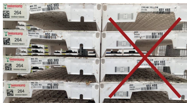
Plateau BKX avec autocollant

Attention ! N'enlevez pas l'autocollant du plateau BKX. Placez le code-barres à l'extérieur du chariot.